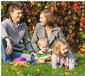
Prato 1: bimbi