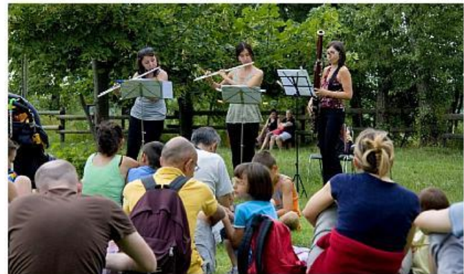
Il terzo prato (P3) come palco per un concerto