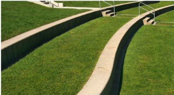
Le terrazze (T1, T2) come spalti per potersi sedere