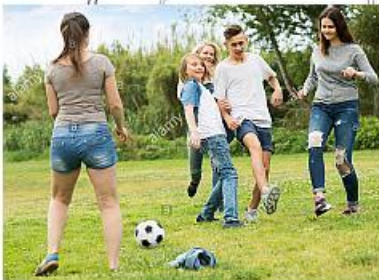
Prato 2: giochi